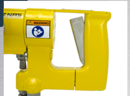
D-Handgriff oder Pistolenhandgriff