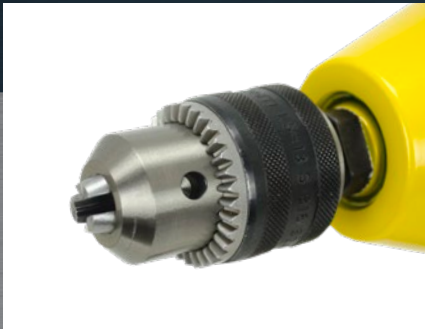
Zahnkranzbohrfutter bis \varnothing 13 mm